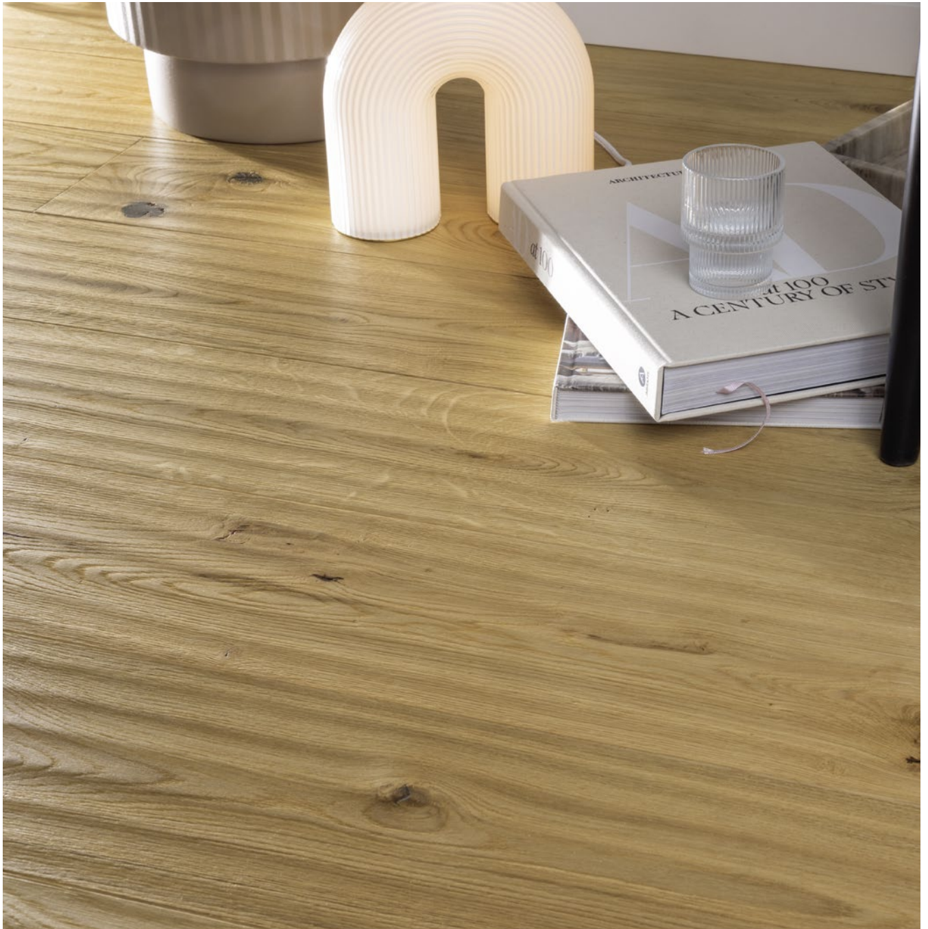
Mirage | Trendtime 8 | Eiche Kalahari naturgeölt plus 1751112