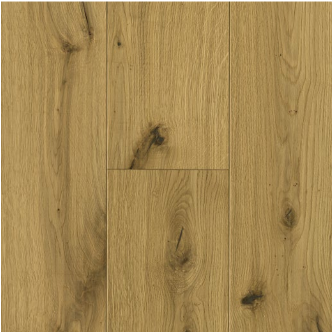
Eiche Savanna Rustikal | naturgeölt plus

Eiche Savanna lebt von subtilen Kontrasten. Teils gesägte Strukturen verschmelzen mit fließend gehobelten Konturen und formen so einen unverwechselbaren Rhythmus. Jede Diele wirkt, als hätte die Zeit selbst ihre Spuren hinterlassen. Eine tiefe Bürstung hebt die Maserung und die natürlichen Merkmale der Eiche hervor und verleiht der Oberfläche eine eindrucksvolle Authentizität – wellenförmig wie Wüstensand, voller Wärme und taktiler Schönheit.